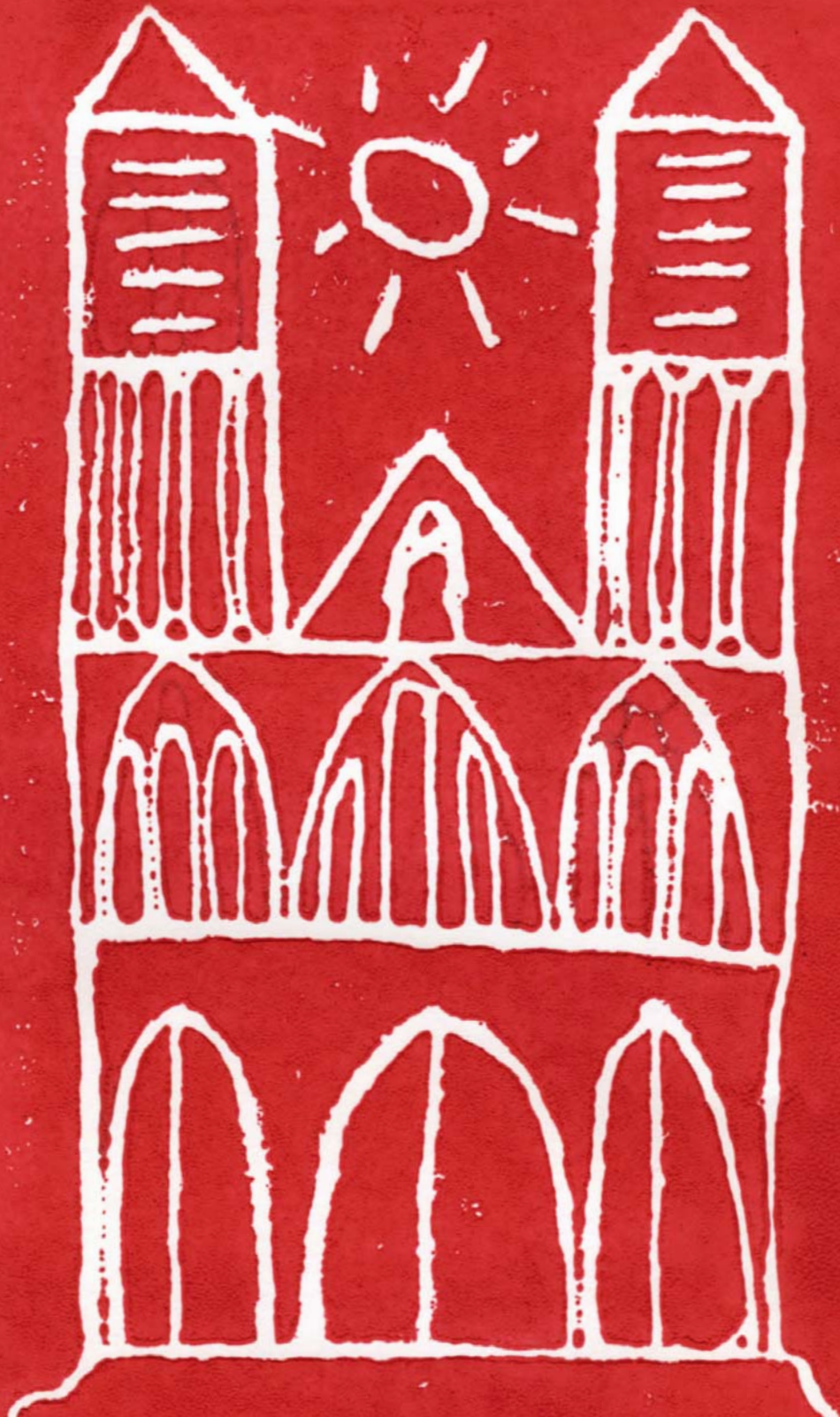
La cathédrale, gravure sur polystyrène, élève de cycle 3