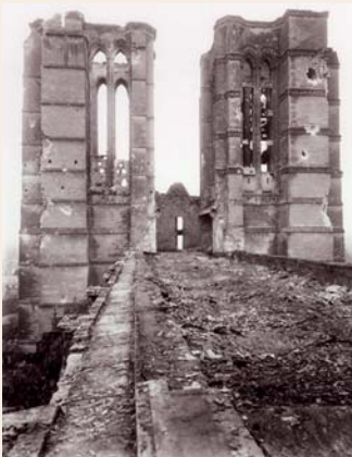
La cathédrale incendiée, photo après 1918, Cathédrale Notre-Dame.

Aux portes de l'Île-de-France, Noyon est occupée par l'armée allemande dès septembre 1914. Débute alors la germanisation de la cité picarde. Délivrée en mars 1917, la ville de Noyon va connaître les bombardements intensifs des deux camps adverses pour être en août 1918 détruite à 80%. De l'hôtel de ville à la charpente de la cathédrale, les murs et les monuments de Noyon gardent et racontent son histoire lors du premier conflit mondial.