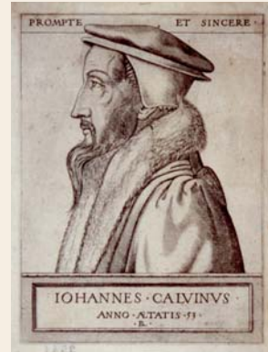
Calvin à 53 ans, gravure, XVI e siècle, musée Jean Calvin.

Lieux d'exploration : cathédrale (chapelle Notre-Dame-de-Bon-Secours), bibliothèque du Chapitre, hôtel de ville, musée Jean Calvin.