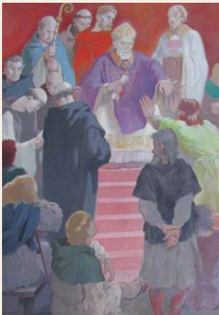
La Charte des libertés communales, peinture marouflée, 1942, Hôtel de Ville.

Noyon devient siège épiscopal au VI e siècle. La cathédrale actuelle, édifiée de 1145 à 1235, est l'une des premières cathédrales gothiques. L'ensemble canonial et épiscopal de Noyon est le plus bel exemple de quartier cathédral aujourd'hui conservé au nord de la France. Cet ensemble constitue un support pédagogique de premier ordre pour une approche de l'architecture religieuse et de son contexte historique et topographique.