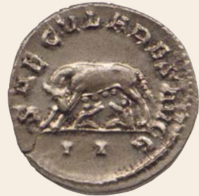
La louve, Romulus et Rémus, Monnaie romaine, II e siècle, musée du Noyonnais.

Lieux d'exploration : crypte archéologique et sous-sol de la chapelle épiscopale (vestige du rempart gallo-romain), musée du Noyonnais (collections archéologiques).