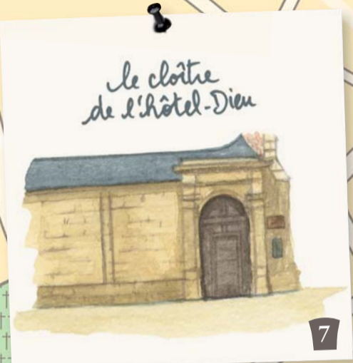
le cloître de l'Hôtel-Dieu