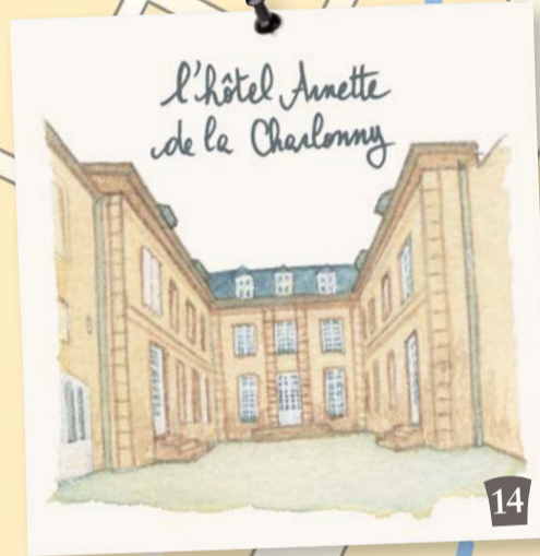
l'hôtel Amette de la Charlonny