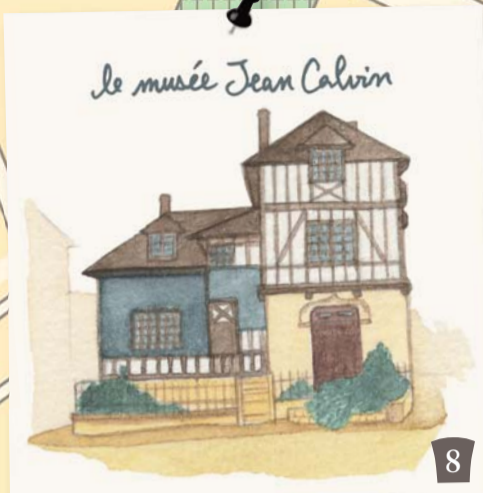
le musée Jean Calvin