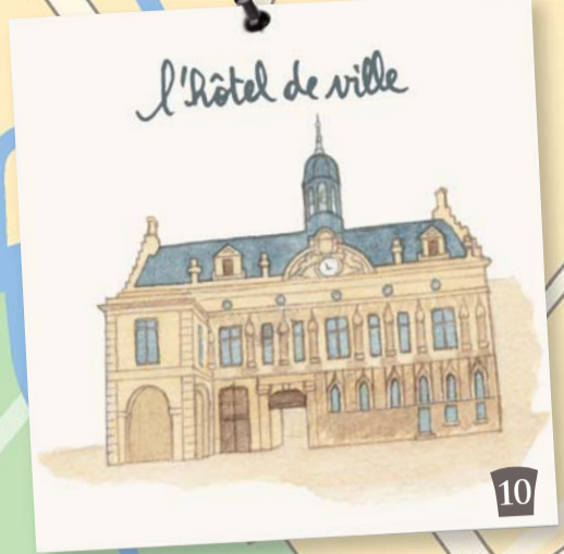
l'hôtel de ville