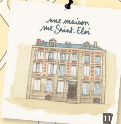
une maison rue Saint-Eloi