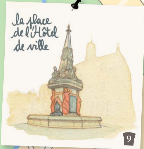
la place de l'Hôtel de ville